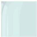
C Klarglass 10 mm